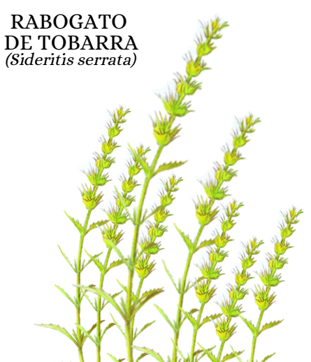
RABOGATO DE TOBARRA ( Sideritis serrata )

ENG. The Botanical Garden of Castilla-La Mancha has focused primarily on the conservation of threatened flora, botanical research, and environmental education since its inauguration in 2010. It covers 7 hectares and houses around 29,000 plants from 2,100 different taxa, with a strong emphasis on Mediterranean continental flora. The conservation itinerary recreates the natural habitats of Castilla-La Mancha, highlighting endangered and endemic species such as the False Cytisus and the Tobarra Ironwort, among many others. It also features plants of ornamental, agricultural, medicinal, and industrial interest, as well as a greenhouse with optimal conditions to host tropical flora, all within its classic itinerary. Furthermore, it is the first botanical garden in the Iberian Peninsula to receive the Ecological Excellence Certification, distinguishing itself through its sustainable management and commitment to biodiversity. Its environmentally friendly practices include the application of ecological treatments, the optimization of water resources, and the use of the soil's natural fertility while prioritizing biodiversity and the enhancement of ecosystem services.